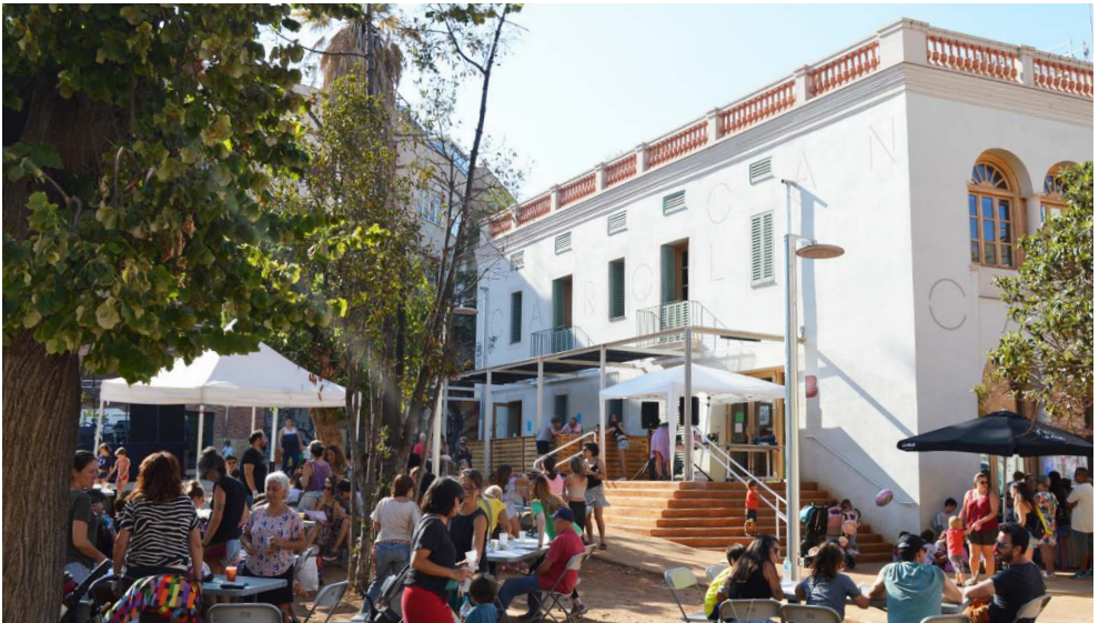
Festa Major de Vallcarca a Can Carol, 2023

A partir de quan es faci fosc... Pintures fluorescents!