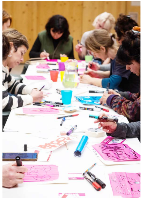
Taller d'enganxines pel 8M, 2025

Organització a càrrec de: Espai Relacional