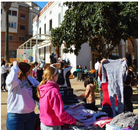
Mercat d'Intercanvi de la Comissió Famílies, 2025