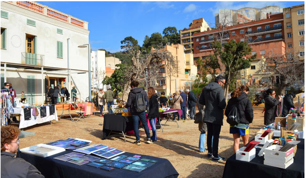
Mostra d'Artesanes de proximitat VKK VIU, 2025

Organització a càrrec de: Comissions de Can Carol, FEACCC i Espai Relacional