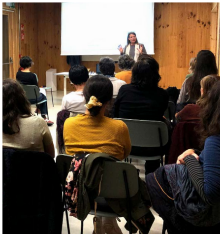
Xerrada organitzada per la Comissió Salut, 2023