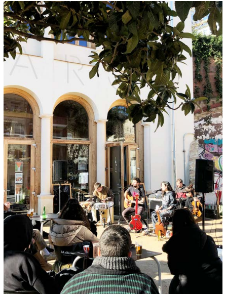
Vermut Musical amb Columba desembre 2024