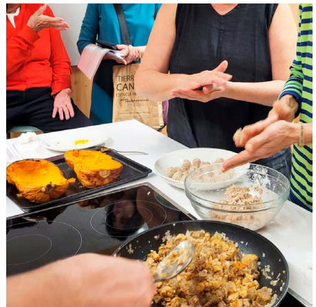
Cuinem a Can Carol Tardor 2024