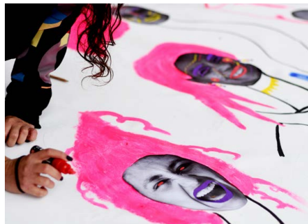
Jornada pel 25N 2021

Organització a càrrec de: Espai Relacional