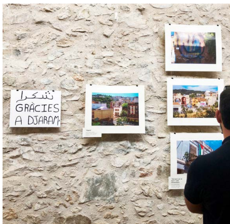
Exposició de BAC Station Vallcarca tardor 2024