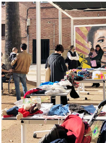
Mercat d'Intercanvi, Tardor 2022