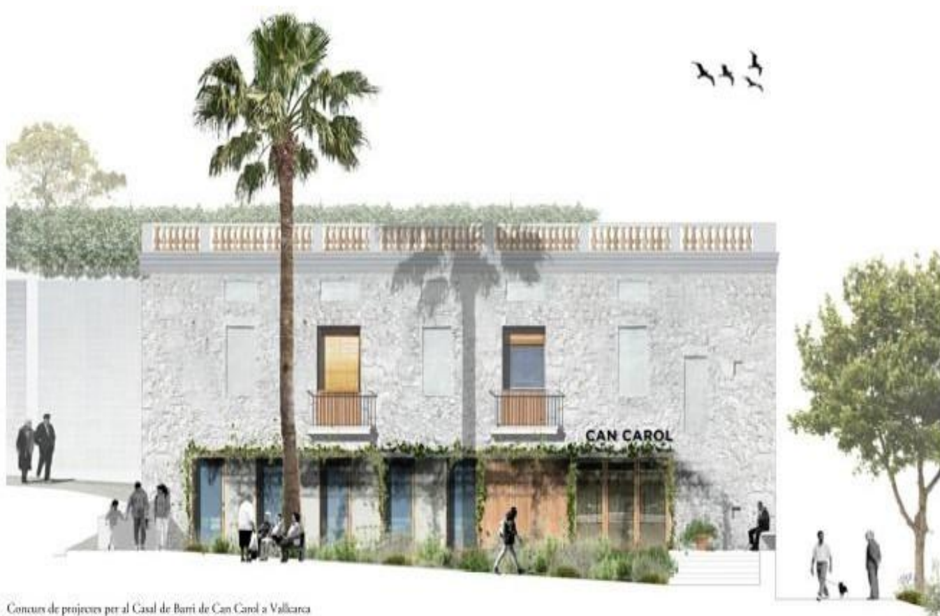
Concurs de projectes per al Casal de Barri de Can Carol a Vallcarca

Federació d'Entitats Amigues de Can Carol i Consolat FEACCC