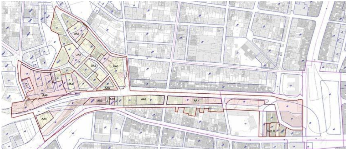
(Vallcarca, Plànol del MPGM del 2002)

Dit d'una altra manera, terreny abonat per l'aparició del MPGM del 2002 que preveia entre d'altres, la construcció d'un vial que uniria la plaça de Lesseps amb les Rondes, la destrucció de tots els edificis de l'Avinguda Vallcarca (costat Llobregat), l'expulsió de tot el seu veïnat i la construcció de diferents edificis de gran alçada a un preu de mercat inaccessible per les rendes mitges de la gran majoria de persones que hi viuen.