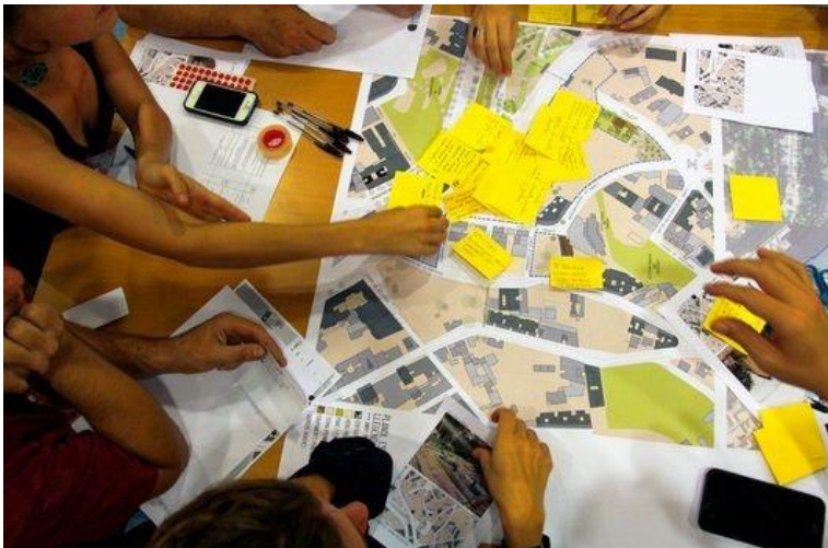
(A la fotografia, Taula de treball de les jornades participatives del 2014)

L'any 2014 es constitueix a Vallcarca la Taula d'entitats pel diàleg i la convivència; un esforç per apropar postures entre el veïnat i anar tots a una en el tema urbanístic. Fruit d'aquest treball i sota el títol "El barri que volem", al novembre del mateix any es convoquen unes jornades participatives on per primera vegada en gairebé 30 anys les veïnes tenen la possibilitat d'opinar i exposar les seves inquietuds en matèria d'inversions, infraestructures i equipaments del seu barri.